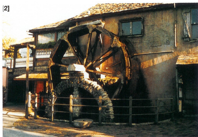
[1] De 'City Hall' met op de eerste verdieping het Lightner-museum [2] Spaanse bakkerij met de watermolen aan de straatkant

door de City Gate zien we vlakbij de zeekust de vestingmuren al opdoemen in de schitterende donkergele avondzon. Deze Spaanse vesting heeft de karakteristieke vorm van een citadel, die zorgt voor prachtige slagschaduw in de ondergaande zon. De kanonnen staan nog steeds strategisch opgesteld met hun loop op zee gericht. 'De vesting heeft in 1702 en in 1740 stand gehouden tegen vijandige aanvallen door onder meer de Britse legers', vertelt de reisgids ons.